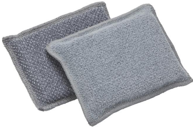
Détail côté doux :