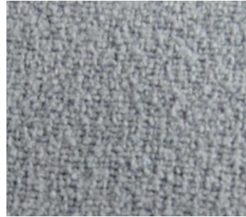
Détail côté grattant :