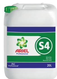
ARIEL PROFESSIONAL S4 BLANC MAX