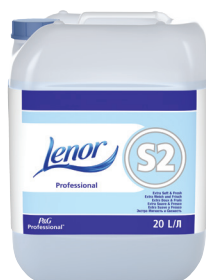
LENOR PROFESSIONAL S2 ADOUCISSANT