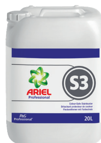
ARIEL PROFESSIONAL S3 DÉTACHANT PROTECTEUR DE COULEUR